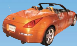
トランクリッドアウター 及びストレージリッドアウター