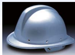
消防用ヘルメット