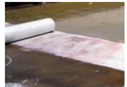
FRP防水工事施工現場