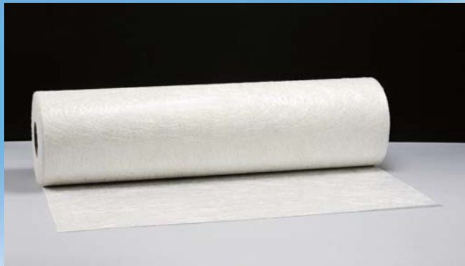
チョップドストランドマット